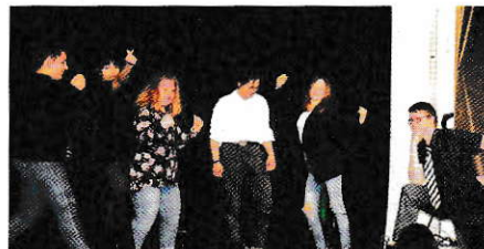
Die Theater-AG der Klassen 8 bis 10 trug Ausschnitte aus Macbeth, Hamlet, sowie Antonius und Cleopatra vor

6b, die Ausschnitte aus ihrem Stück „Die Lesenacht“ zeigten. 29 Schülerinnen und Schüler kamen zur Lesenacht in die Bibliothek und erlebten hautnah die Geschichten, die der Bibliothekar zum Besten gab. Die Zirkus AG balancierte danach noch auf der Show-