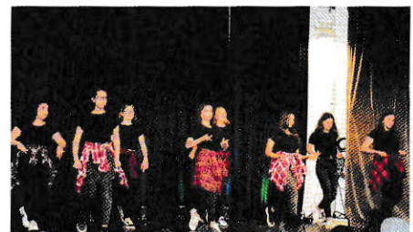
Ihren Tanz hatten diese Mädchen selbst entwickelt und einstudiert