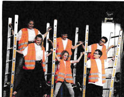
Unter anderem zeigte die Zirkus AG auch Akrobatik mit Leitern